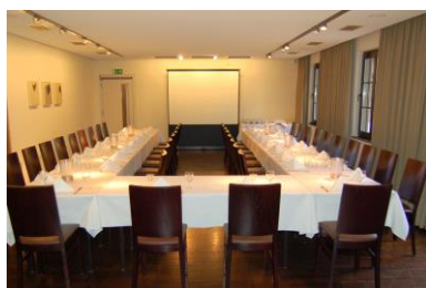
U-Form bis maximal 42 Personen (innen & außen bestuhlt)