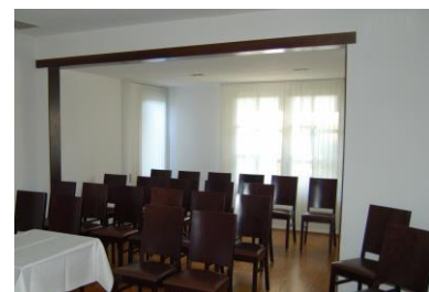
Stuhlreihen bis maximal 20 Personen

Alle Preise verstehen sich Brutto inklusive 19 % MwSt